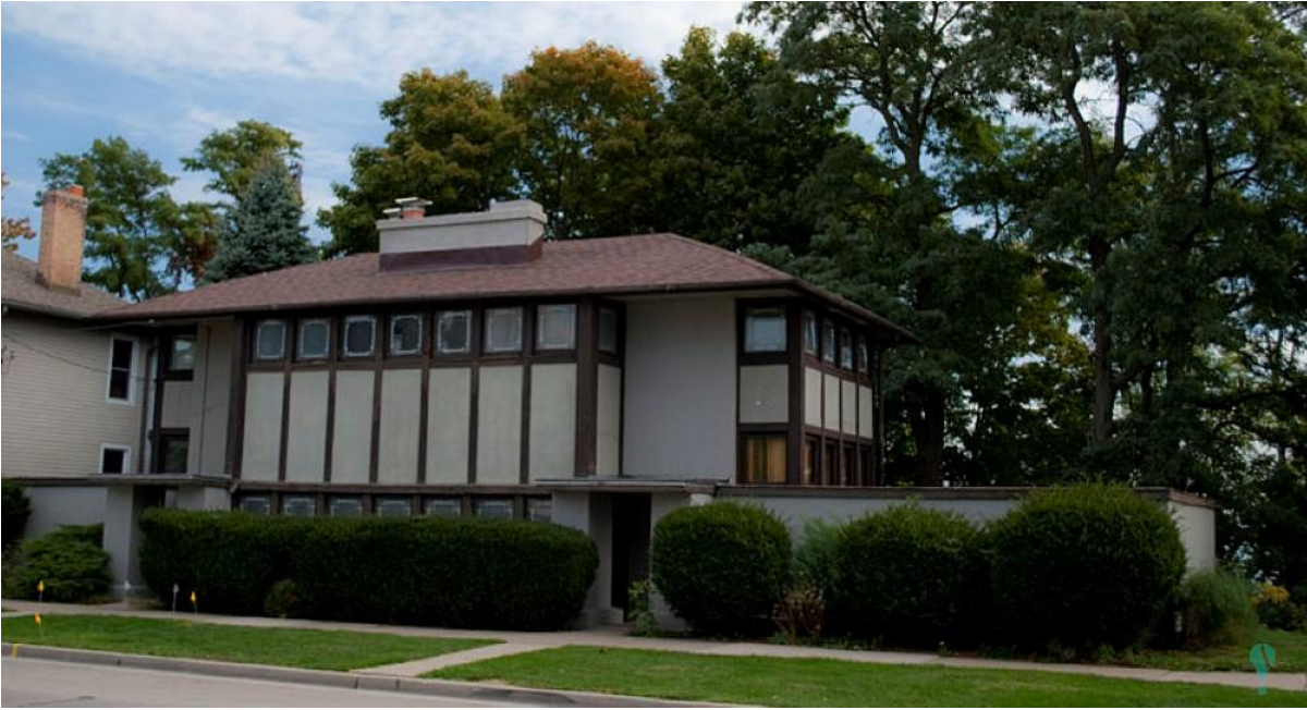
THOMAS P. HARDY HOUSE • 1319 S. MAIN • RACINE WI • FRANK LLOYD WRIGHT • 1905 after Wasmuth Plate XV