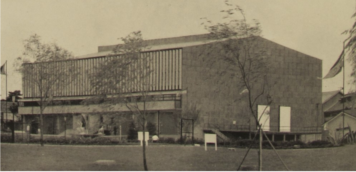
Oldphoto - 1956]