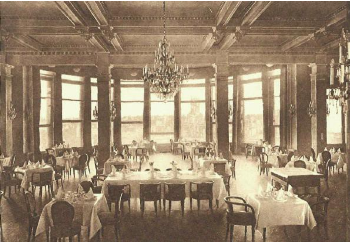
A. von Eten / Public Domain