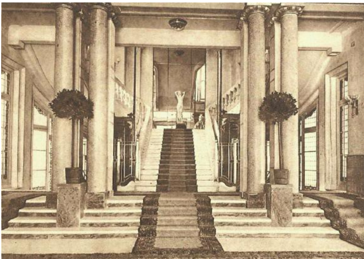
A. von Eten / Public Domain